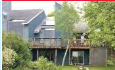
27664777 Vue sur montagnes - luxueux 239,000$ (accès Lac Ouareau) Enchantement par son décor naturel - Belvédère Ouareau - qualité et bon goût