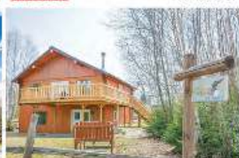
NOUVEAUTÉ ACCÈS NOTARIÉ AVEC QUAI AU LAC DUAREAU 500 800$ MLS 1607896