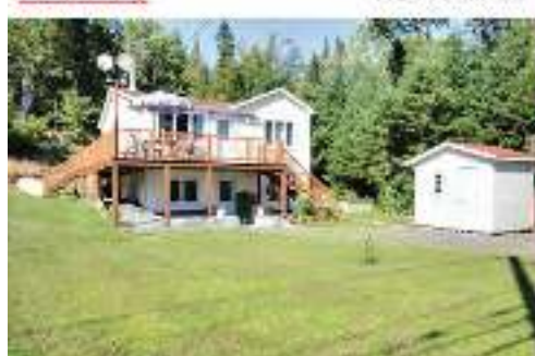
NOUVEAU PRIX BORD LAC PAPINEAU AVEC QUAI NOTARIÉ 159 000$ MLS 21553561