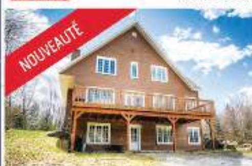
NOUVEAUTÉ ACCÈS NOTARIÉ AU LAC ARCHAMBAULT 424 900$ MLS 13393363