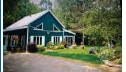
Jolie Maison plain pied, toit cathedral beaucoup de boiserie intérieur, construite avec goût, environnement naturel, solarium quatre saison avec spa. 239 000$ - 22727433