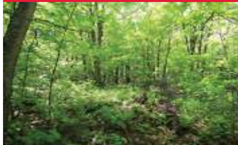
Terrain boisé superficie de 57 930 pieds carrés près du lac Ouareau. $23 900. MLS :23347085