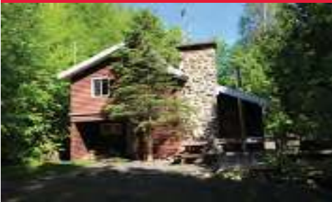
Environnement boisé, toit cathédrale et foyer de pierres pour ambiance conviviale $259 000 MLS 25537926