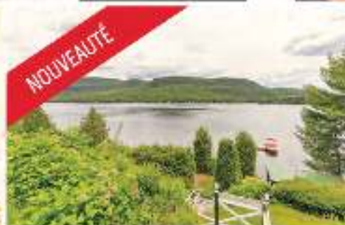
NOUVEAUTÉ BORD DU LAC SYLVÈRE - NAVIGABLE 379 900$ MLS 25327325