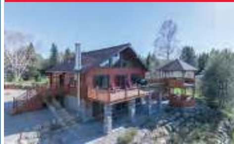
16343648 Lac Ouareau navigable 549,000$ (BORD DE L'EAU) tout en bois - CONSTRUCTION DE QUALITE RECENTE - pour vos vacances !!