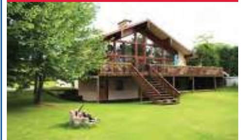
Bord de l'eau, terrain plat, plus de 237 pieds en bordure de la rivière Ouareau, Grand chalet inter-génération au rez-de chaussée, plafond cathédrale, foyer deux face en pierre des champs naturelles, 5 chambres à coucher, près du village et de ces commodités. 579 000$ - 18826799