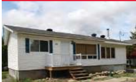
Opportunité pour un accès sur un lac navigable pour les petits budgets. Décor intérieur accentué par le bois. $144 000 MLS :12677655