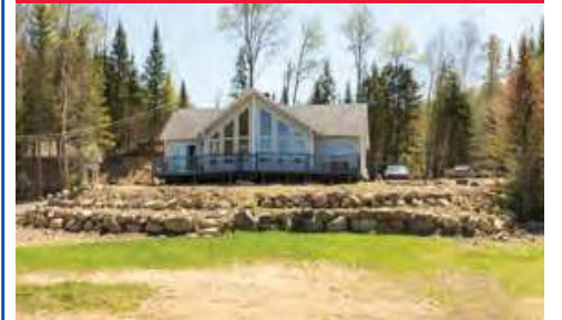
Maison plein, pied, intérieur Cathédral, vue imprenable sur les montagnes et sur le lac Kri, cette propriété construite avec goût vous charmeras par son environnement, centre équestre, piste de VTT et Moto-Neige. 289 000$ - 26560501