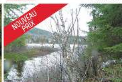
NOUVEAU PRIX BORD LAC ARCHAMBAULT - TERRAIN PLAT 175 000$ + TPS/TVQ MLS 17893102