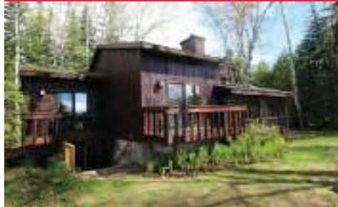
Près de l'eau mais loin de la route sur terrain plat. Orientée sud avec vue à couper le souffle sur l'eau et les montagnes. $549 000 MLS :27604904