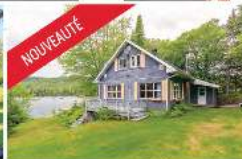
NOUVEAUTÉ BORD LAC ARCHAMBAULT 449 000$ MLS 21164160