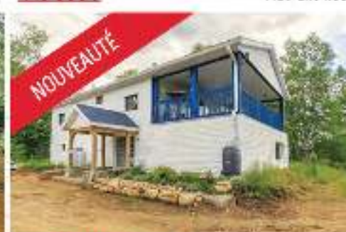
NOUVEAUTÉ BORD DU LAC CROCHE 347 000$ MLS 28215363