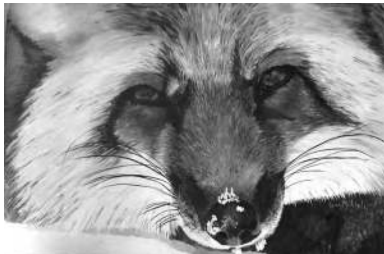
Œuvre de notre animalière Lynne Michiels d'après une photo de Chantal Dupont

Si vous passez à la salle Jules St-Georges, vous y découvrirez des nouvelles œuvres à compter du 17 juillet. En attendant nous nous préparons