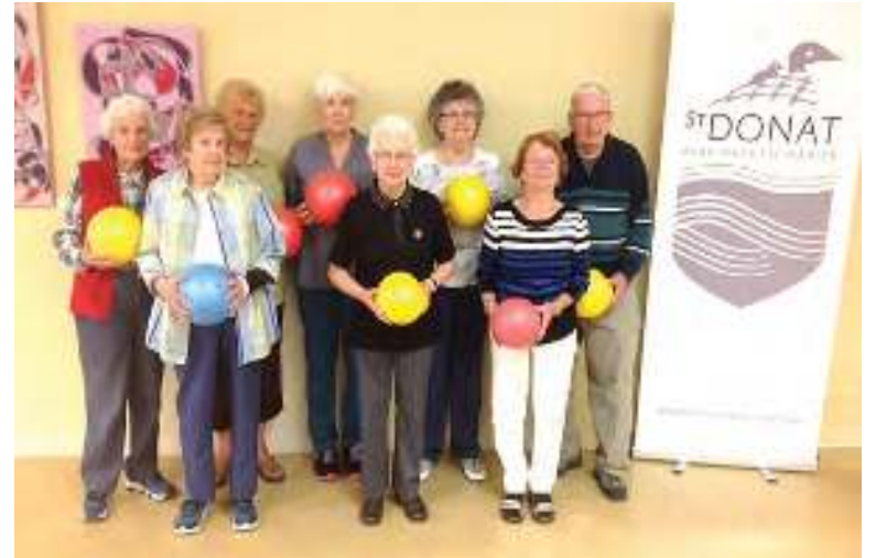
Voici le groupe de nos "super" vieux!