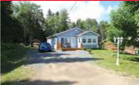
NEUF, Joindre la ville à la nature à un prix abordable $174 000 MLS: 24684212