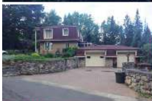
NOUVEAU PRIX BORD LAC GRENIER - CHERTSEY 299 000$ MLS 23841409