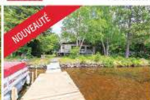
NOUVEAUTÉ BORD LAC ARCHAMBAULT 535 000$ MLS 2205107