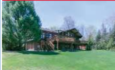
23923222 Lac Blanc/ Ouareau 599,000$ (BORD LAC) POSS.LOCATION INTERGÉNÉRATION - VUE sur Garceau - Plage de sable - sports nautiques