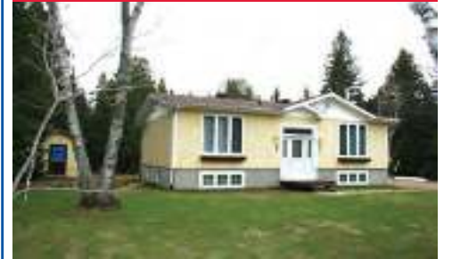
Situé à proximité de tous les service accès notarié - à la rivière ouareau communiquant avec lac ouareau. 185 900$ - 25672930