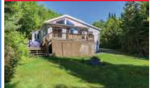
Beau chalet entouré d'arbre mature au bout d'une rue sans issue, une plage pour la baignade, Balcon et terrasse avec vue sur Lac. 335 000$ - 14682222