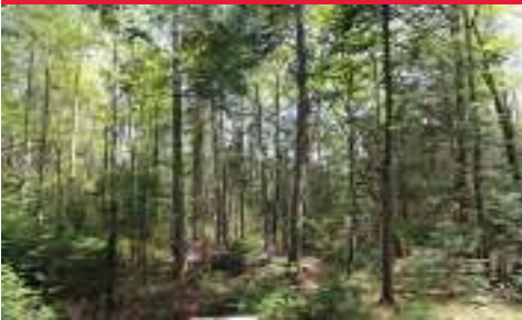
Terrain boisé 49 346 pieds carrés. Accès à la rivière Pembina. $23 000. MLS 27849641