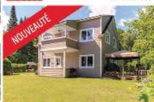
NOUVEAUTÉ ACCÈS NOTARIÉ AU LAC DUAREAU 224 500$ MLS 19958321