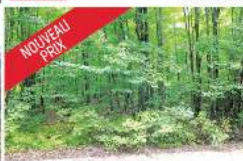
NOUVEAU PRIX ST-DONAT - TERRAIN PLAT 28 900$ MLS 111249930