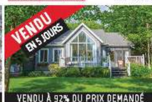
VENDU EN 5 JOURS ACCÈS NOTARIÉ LAC BLANC 369 000$ MLS 25420260