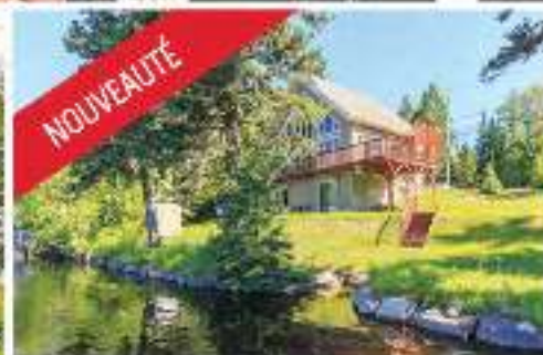
NOUVEAUTÉ LANTIER - BORD LAC LUDDER 329 000$ MLS 28322955