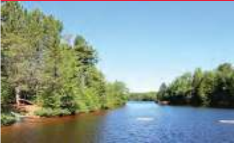
RARE Terrain plat, secteur recherché et paisible au bord du Lac Ouareau à NDM $279 000 MLS 13757053