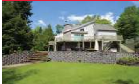
Balcons sur toutes les façades de la maison avec portes jardin. Mezzanine et salon cuisiné à aire ouverte. Terrain plat aménagé. $798 000 MLS : 23472279