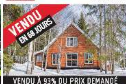
VENDU EN 68 JOURS ACCÈS NOTARIÉ LAC BLANC 274 000$ MLS 2109057