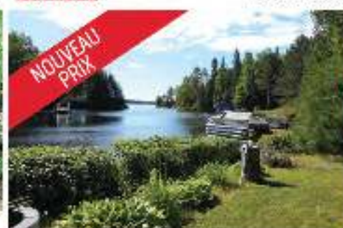
NOUVEAU PRIX BORD LAC SYLVÈRE 447 000$ MLS 2566356