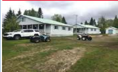
23682306 Camp de pêche/chasse Zec Lavigne 325,000$ (BORD LAC CARTIER)2 Chalets - location - Quai - tout inclus- autonomie électricité