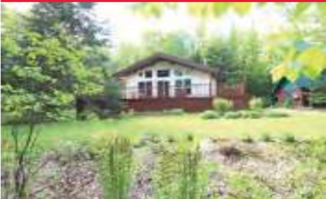
Accès Rivière Ouareau, luminosité abondante sur terrain aménagé $238 000 MLS: 28492639