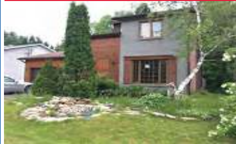
28525271 Nouveau sur marché - Coeur du village 154,900$ (VILLAGE)277 rue Ritchie - sous l'évaluation - à qui la chance !