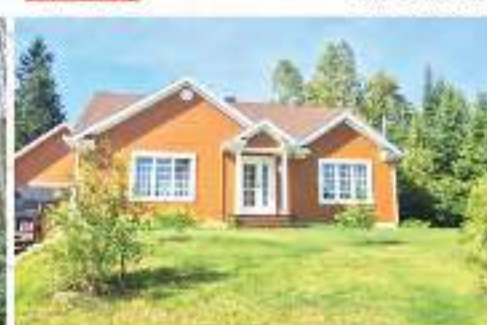
NOUVEAUTÉ VILLAGE ST-DONAT 255 000$ MLS 20647574