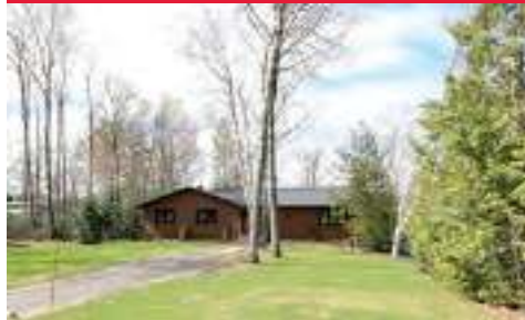
Nouvellement rénovée avec un luxueux garage entièrement aménagé pour les activités sportives et récréatives. Balcon offrant une vue sur l'eau. $748 000. MLS: 15740631