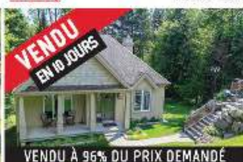
VENDU EN 10 JOURS STE-ADÈLE 239 000$ MLS 9853626