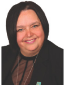
Chers citoyens et villégiateurs,