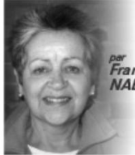
par Françoise NADON