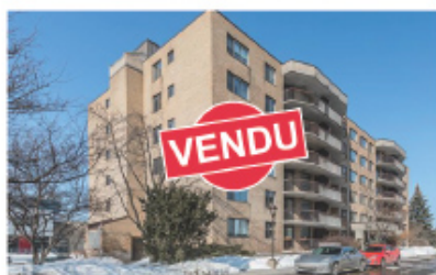
Acheteurs comblés! 8901 Rue Marcel-Cadieux, app. 307 Montréal (Ahuntsic-Cartierville)