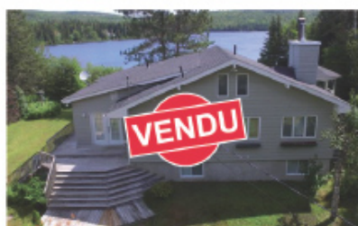
Acheteurs bien servis! 14 Ch. du Lac-Barbeau N. Saint-Donat