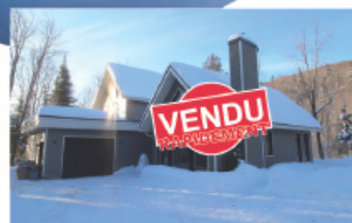
Félicitations aux acheteurs! 145 Ch. du Domaine-Escarpé Saint-Donat