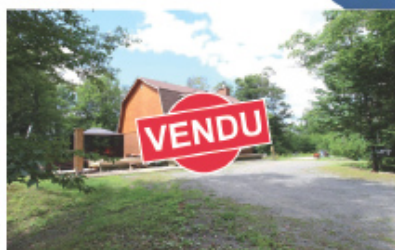
Bienvenue à une nouvelle famille! 2239 Route 125 Notre-Dame-de-la-Merci