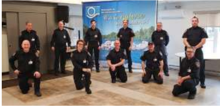
Les premiers répondants de Notre-Dame-de-la-Merci

D'abord, j'aimerais prendre le temps de souhaiter une belle rentrée scolaire à tous les élèves, enseignants, personnels de soutien et vous demandez d'être prudent sur les routes avec la circulation des véhicules scolaire. En effet, les conducteurs d'autobus scolaires signalent à l'avance au moyen des feux jaunes leur intention de s'immobiliser sous peu, notamment afin de permettre aux écoliers de monter à bord ou de descendre du véhicule. Lorsque ces feux sont allumés, les autres usagers de la route doivent se préparer à arrêter. Ils sont dès lors dans l'obligation de ralentir, et ce, qu'ils soient situés à l'avant de