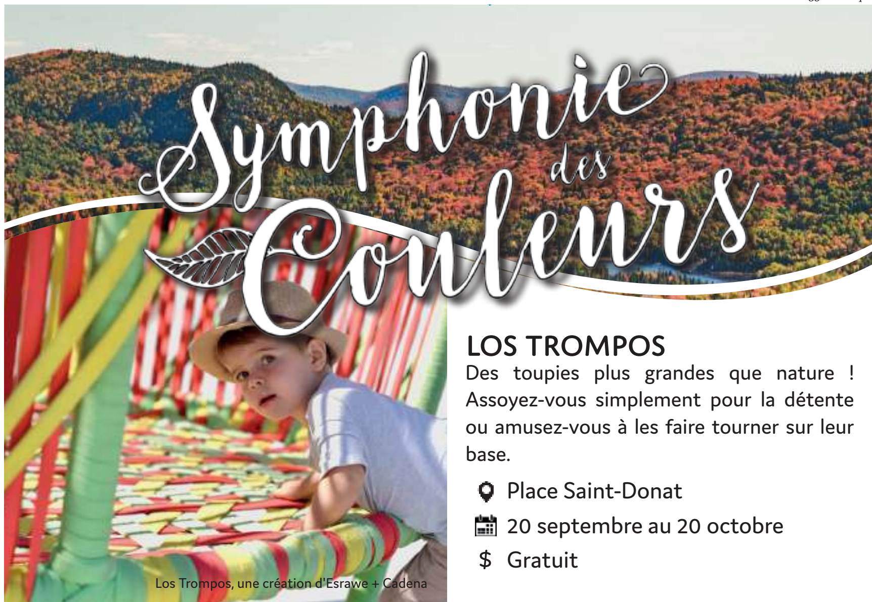
Los Trompos, une création d'Esrawe + Cadena