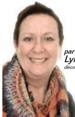
par Lyne Lavoie décoratrice