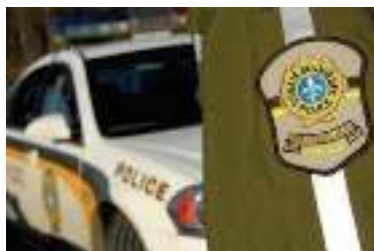
Programme Bon voisin Bon œil Rappelons que ce programme

de protection du voisinage vise à prévenir les vols par effraction dans les résidences.